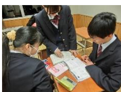
資格取得に向けた学習