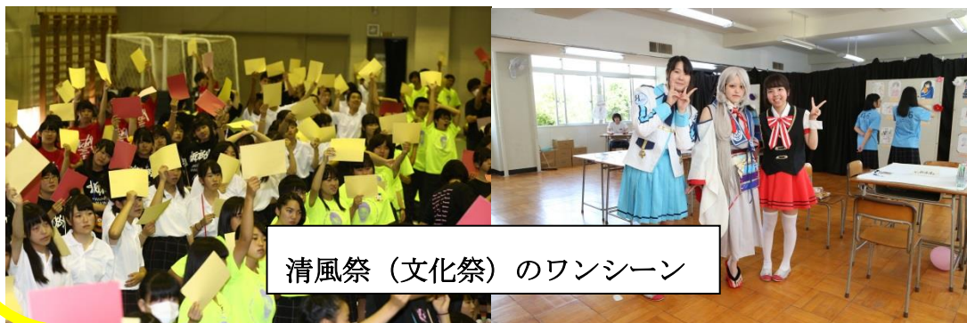
清風祭（文化祭）のワンシーン

※学校説明会・進学フェアに関するご質問などは本校教務部（049-286-7501）まで