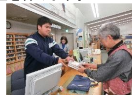
インターンシップの様子