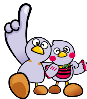
埼玉県マスコット 「コバトン」 「さいたまっち」