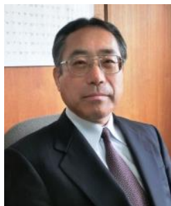
埼玉県立鶴ヶ島清風高等学校長