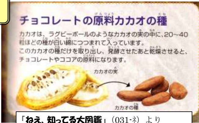
「ねえ、知ってる大図鑑」(031-ネ)より

「魅惑のチョコレート」 大森由紀子著 (596-オ) バレンタインの起源、チョコの歴史からケーキの作り方まで。大人の遊び方シリーズ。